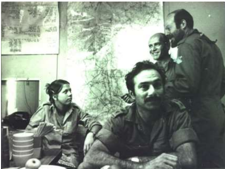
סדנת צנובר במלחמת יום כיפור (1973)

המחרת יוצאת חוליה שנייה של מכונאים מסדנה-סדנת רק"מ פצ"ן שמתקנים את התקלה. כלי שנפגע ברמה נמוכה תוקן במקום, כלי עם פגיעה גדולה יותר נשלח לתיקון בעורף, וכלי עם פגיעה שלא ניתנת לתיקון פוצץ במקום ונקבר. לאחר שהכלי תוקן יש מערכת שמודיעה על כך לחטיבה. כמה ימים לאחר פרוץ המלחמה הצבא הסורי כבר הגיע לנפח, צה"ל החל להדוף אותם ולהגיע לשטחי סוריה. צה"ל התקרב לדמשק. בשלב זה כבר אין לחימה. הסכם הפסקת האש היה בסוף אוקטובר, אך אנחנו עוד היינו בסוריה לאחר מכן, ונסוגנו בשלב מאוחר יותר. הפסקת האש הייתה מנקודת עליונות שלנו ונחיתות של הצבא הסורי. הצבא הסורי עבר מפלה טוטאלית. במלחמת יום כיפור באה לידי ביטוי בצורה מאוד משמעותית היתרון האנושי של חיל החימוש. בעצם אפשר להגיד שחיל החימוש נתן סוג של יתרון לצה"ל בכך שהצליח לתקן כלים כ-3 פעמים ולהחזירם לקרב."